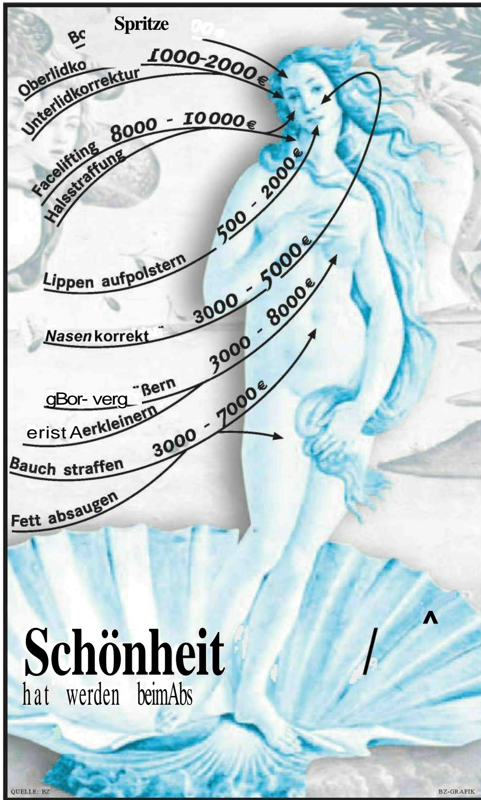
ILLUSTRATION: „GEBURT DER VENUS“ VON BOTTICELLI, UM 1484-1486

Sie macht den Oberkörper frei, spitz ragen die beiden bandagierten Kegel nach oben. Es tut schon beim Hinsehen weh. Alles ist von dem weißem Verband verdeckt, fast unwirklich schauen die beiden roten Brustwarzen heraus. Muss man Mitleid haben mit einer Frau, Fortsetzung nächste Seite